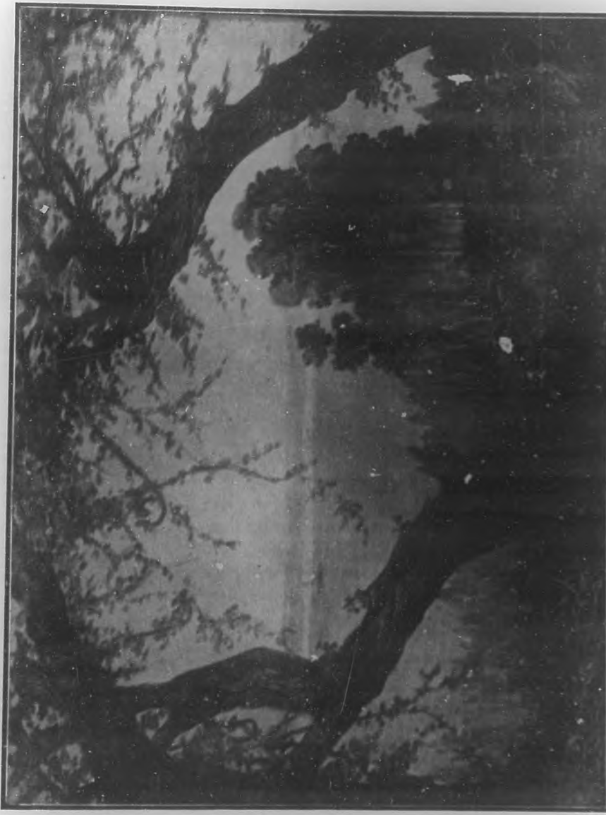
(Grabado titulado de BOHEMIA)