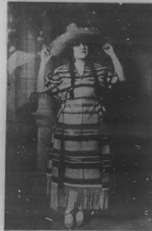
LA ESTRELLITA MEXICANA

Notable y muy simpática triple que debutará la próxima semana en el teatro "Payret", con la compañía del popular actor Regino López.