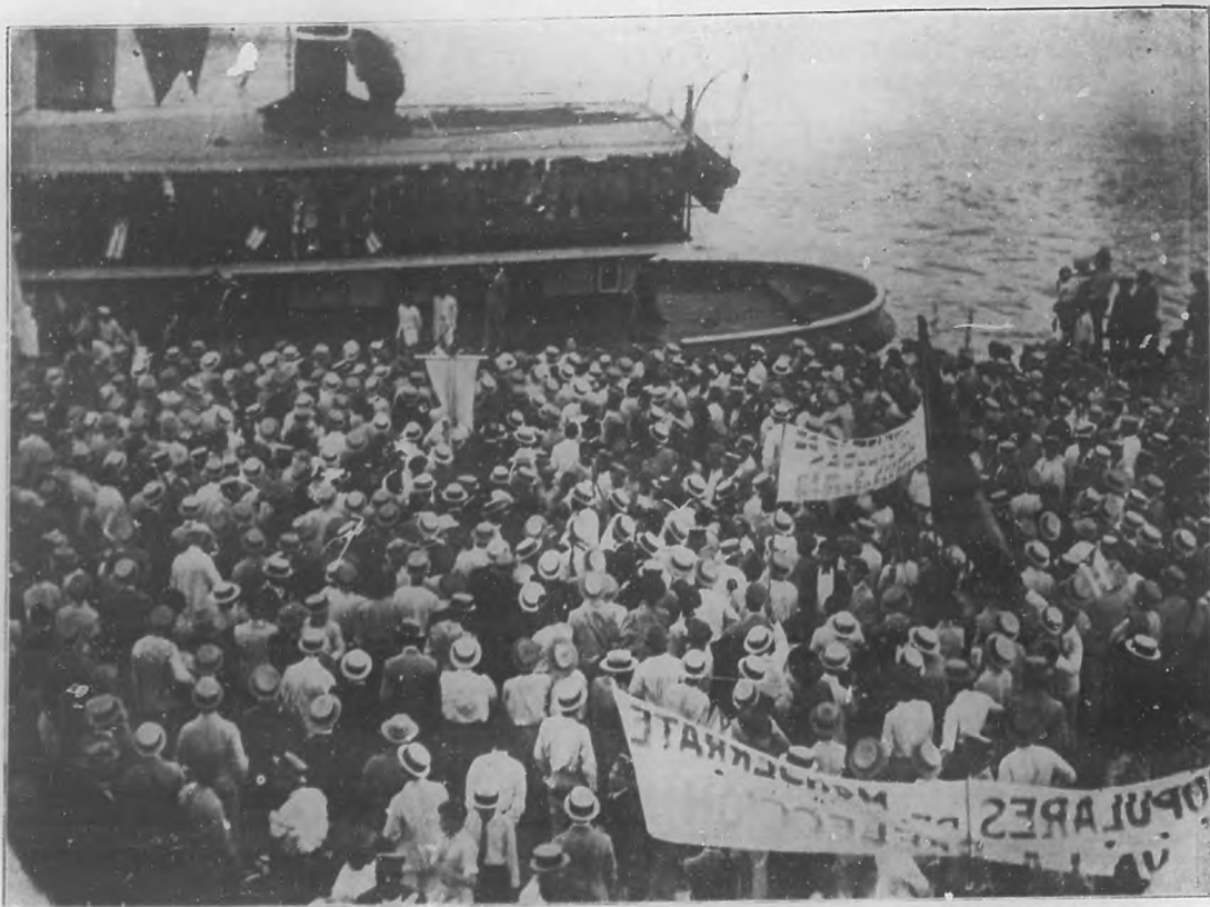
EN HONOR DEL DR. CUÉLLAR DEL RÍO. —La inmensa muchedumbre, en la que tenían su representación todas nuestras clases sociales, que acudió al muelle a recibir al doctor Cuéllar del Río, para rendirle vibrante homenaje de admiración y simpatía por el éxito de la misión financiera que acaba de realizar en los Estados Unidos.