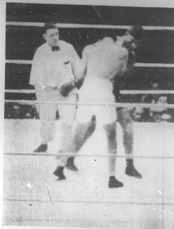
Dempsey (el de la trusa blanca) se abalanza sobre Firpo en el comienzo del segundo round. La foto muestra al campeón pegándole con la derecha sobre el corazón al argentino, golpe que anterior al de la quijada que le produjo el knockout.