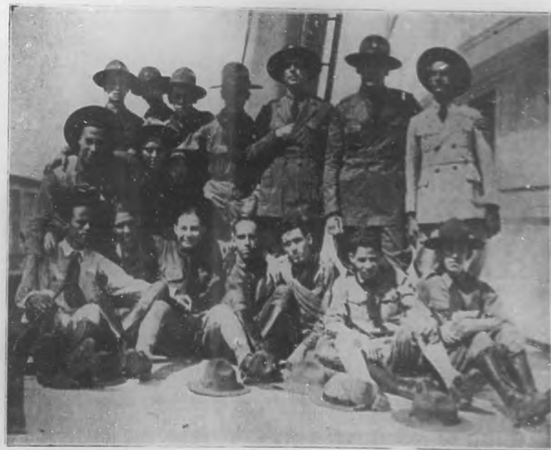
LA EXCURSION DE LOS "BOY-SCOUTS" CUBANOS. —Los exploradores cubanos que partieron el 15 del actual rumbo a Cayo Hueso, donde son constantemente festejados. Grupo fotografiado en el vapor "Cuba" en el momento de salida.

También concurren un numeroso grupo de distinguidos caballeros.