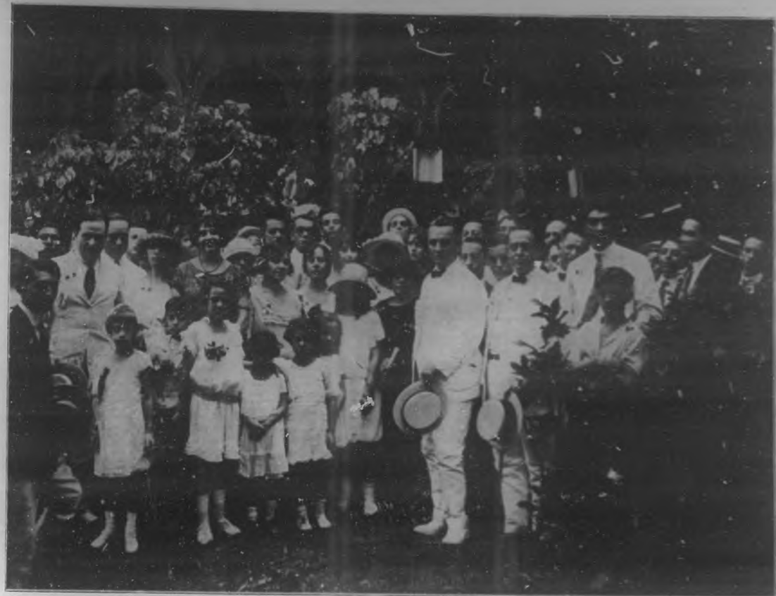
EL ANIVERSARIO DE LA INDEPENDENCIA MEXICANA. —Grupo de las personas concurrentes al almuerzo efectuado el día del aniversario de la Independencia de México, en los jardines de "La Polar".

priá, tuvo la feliz iniciativa de organizar un acto que diera oportunidad a los mexicanos residentes en la Habana, de conmemorar la grata fecha del 13 de Septiembre. La distinguida colonia mexicana correspondió con entusiasmo y patriotismo a la idea de su representante y no obstante que el tiempo se mostró contrario al lucimiento de la fiesta, el regocijo no disminuyó.