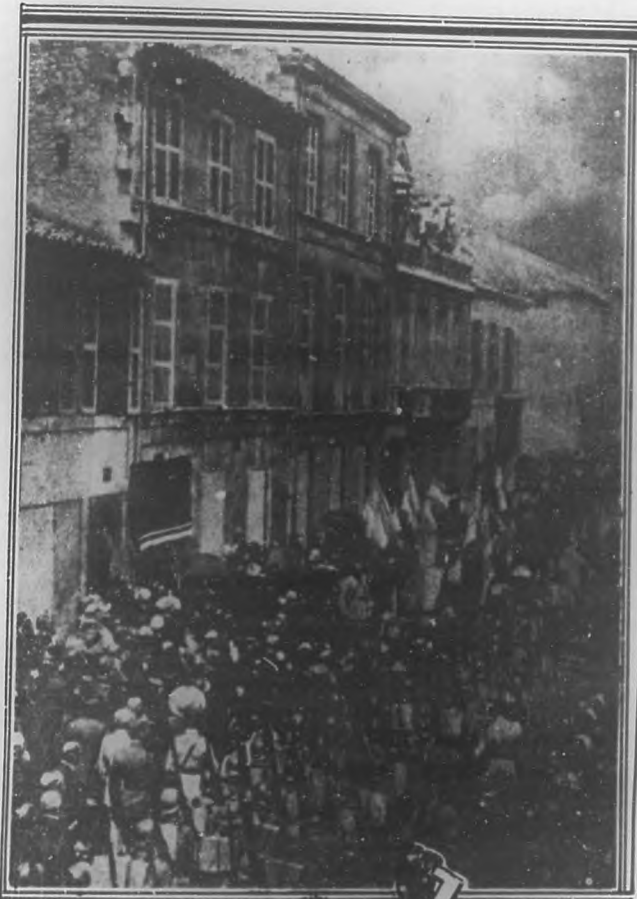
Procesion funeral al gran autor francés Pierre Loti, al salir de su casa de Rochfort.

Acaba de morir en Francia el notable escritor Pierre Loti, el más fino y hondo de los artistas de la pasada generación literaria, a la cual pertenecían Catulle Mendès, Pierre Louis, Anatole France y otros no menos geniales.