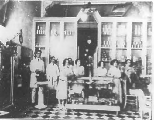
En el salón de ventas de la acreditada Academia de Belleza de la G... se ve un grupo del competente personal que atiende con sumo a... a la numerosa y selecta clientela que de continuo afluye al bien montado y muy bien situado establecimiento.