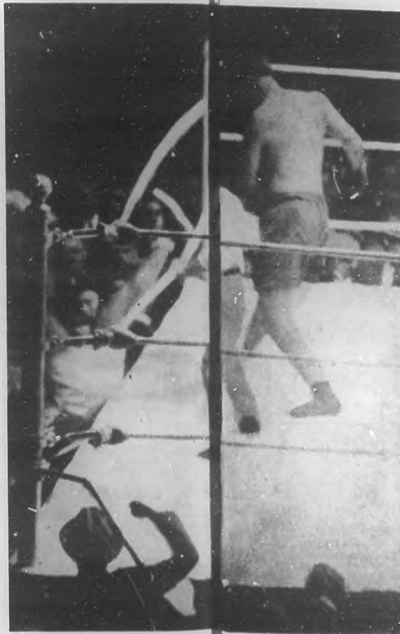
Luis Angel Firpo produciendo una trompada en la historia del pugilismo. Con un terrible derecho Dempsey y lo lanzó sobre los bancos de los periodistas, patas arriba. Los periodistas lo ayudaron a volver al ring, pero Firpo no aprovechó la oportunidad para desalojarlo, a derecho que intentara levantar las manos del tablado "treping".

El caso ya está terminado, no queda apelación alguna. Solamente dos aspectos o hechos de esa lucha titánica han de quedar incrustados en los que la presenciaron alrededor del ring en Polo Grounds, y en los que, a mayor distancia, nos hemos enterado por las abundantes y espléndidas informaciones transmitidas desde el mismo sitio de la pelea por el hilo directo de la Prensa Asociada; y es uno, los procedimientos incorrectos, no permitidos en ningún tiempo, empleados por el campeón en defensa de su título, y permitido por el referee, los jueces, los representantes del argentino, y el mismo público que hoy, históricamente, claman contra ellos. Es el otro, el golpe de la derecha de Luis Angel Firpo, la más formidable de las trompadas que registra la historia del pugilismo, la que puso las plantas de los pies del campeón mirando al cielo, mientras su cabeza se clavaba en el piso, de donde lo extrajeron afanosamente mis caros colegas del otro lado del Atlántico.