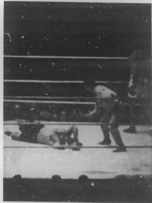
El referee le cuenta a Firpo los diez segundos fatidicos, el argentino trata de incorporarse, pero las fuerzas no le acompañan, y la faja del peso completo queda retenida en poder de Jack Dempsey.