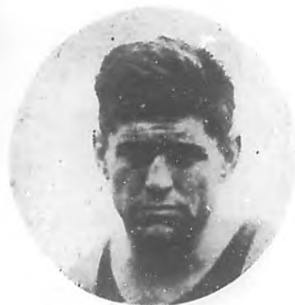
LUIS ANGEL FIRPO

Este es un pleito que ya está fallado, no existe apelación ante un tribunal capaz de rebatir las cosas. Jack Dempsey continúa de campeón del mundo en el peso absoluto. Esa y no otra es la realidad, y a ella tenemos que atenernos. Pero esto no quita para que tengamos que convenir en que es una realidad fraudulenta, una moneda falsa que pasa como signo fiduciario de ley. Los que hemos seguido el paso a paso la actuación del campeón, y la del argentino, en la carrera pugilística, sabemos que las probabilidades estaban por el Ciclón del Lago Salado, como sabemos también que las posibilidades estaban con Luis Angel Firpo.